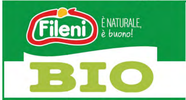
Fileni Fettine sottili di petto di pollo bio al kg