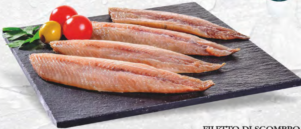
FILETTO DI SGOMBRO al kg