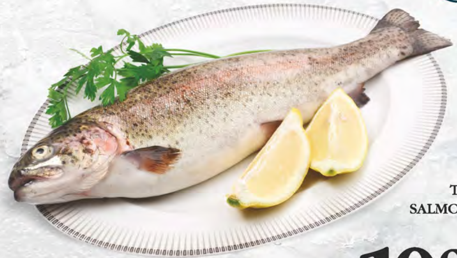
TROTA SALMONATA al kg