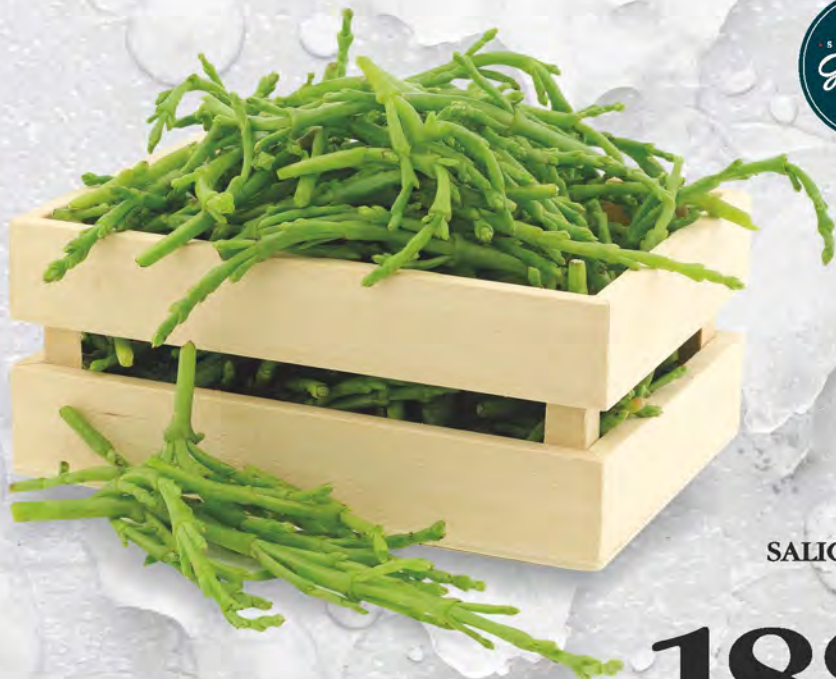
SALICORNIA al kg