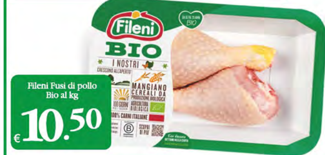
Fileni Fusi di pollo Bio al kg