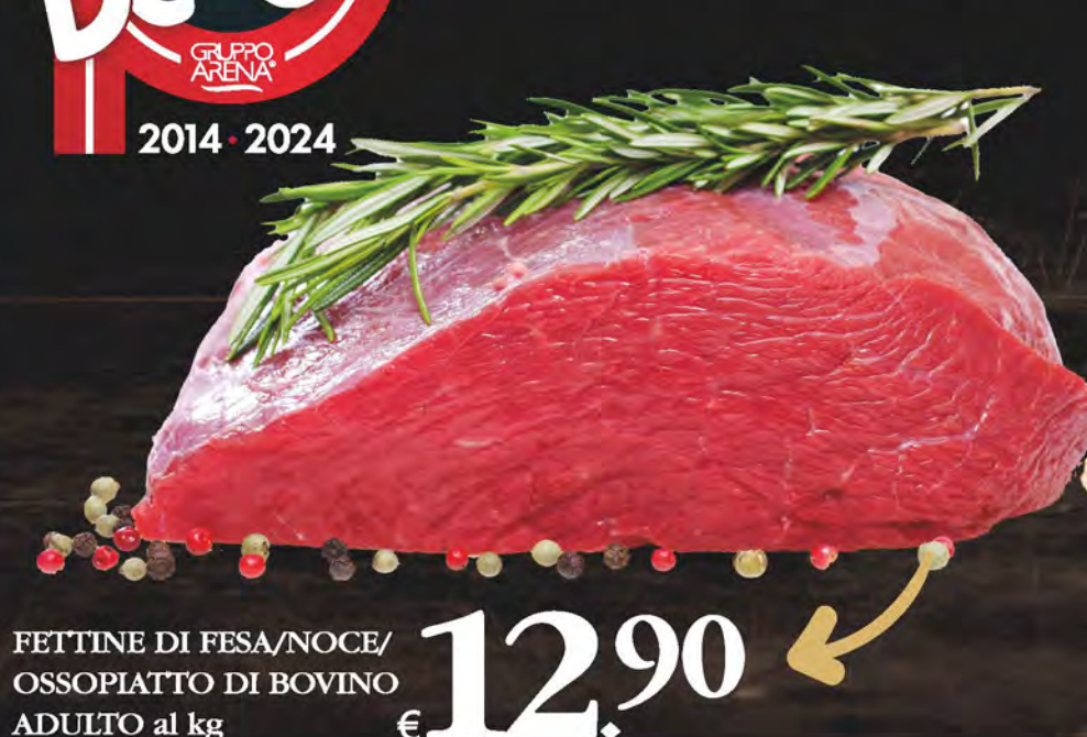
FETTINE DI FESA/NOCE/ OSSOPIATTO DI BOVINO ADULTO al kg