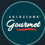
Salmone selvaggio sockeye al kg