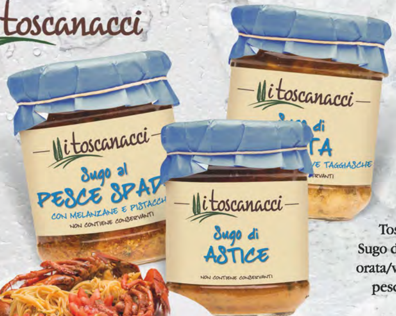
Toscanacci Sugo di astice/ orata/vongole/ pesce spada 180 g