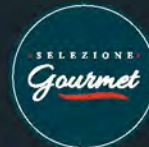
Renzini Gran Carrè Lombo Stagionato di Suino aromatizzato all'Arancia al kg