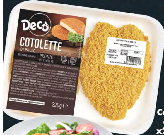
Decò Cotoletta di pollo x2 220 g