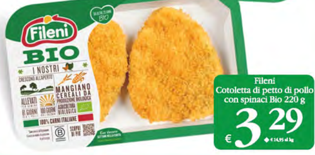
Fileni Cotoletta di petto di pollo con spinaci Bio 220 g