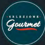
Cioli Prosciutto cotto arrosto al tartufo al kg