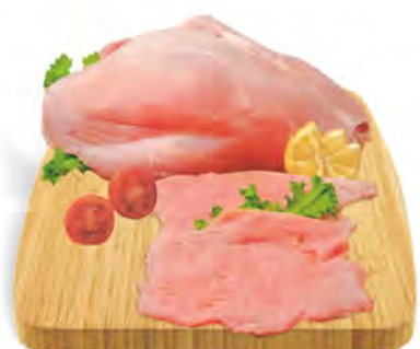
Fesa di Tacchino a fette al kg