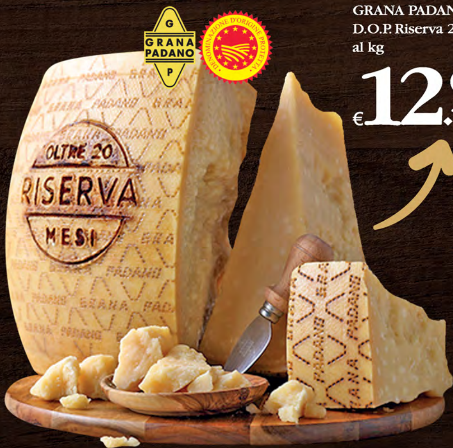
GRANA PADANO D.O.P. Riserva 20 mesi al kg