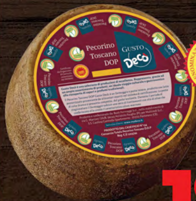
Gusto Decò Pecorino Toscano D.O.P. al kg