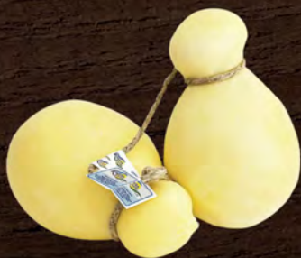
Ragusa Latte Provola al kg