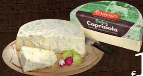
Carozzi Dolce caprizola al kg