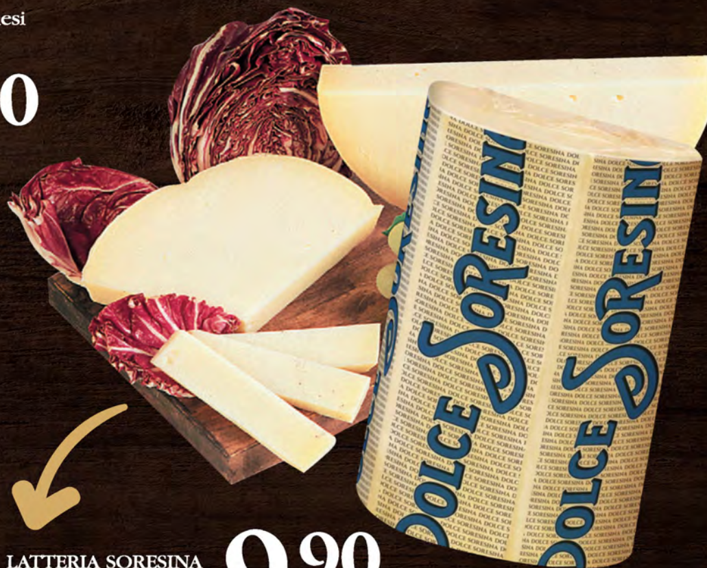
LATTERIA SORESINA Provolone dolce al kg