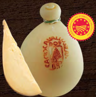
Caciocavallo Silano D.O.P. al kg