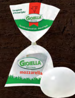
Gioiella Fior di latte ciuffo 200 g