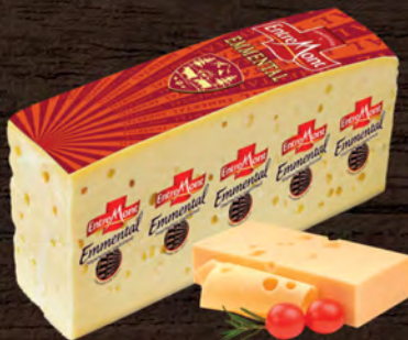
Entremont Emmental al kg