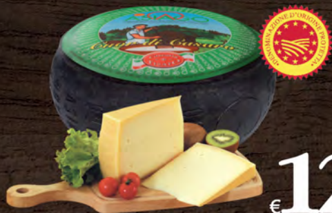
Asiago Cuor di Casaro D.O.P. al kg