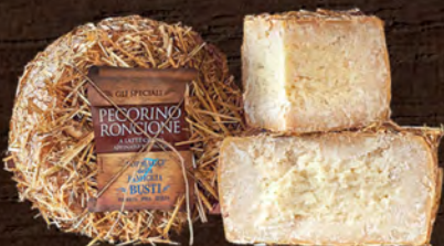
Busti Pecorino Roncione al kg