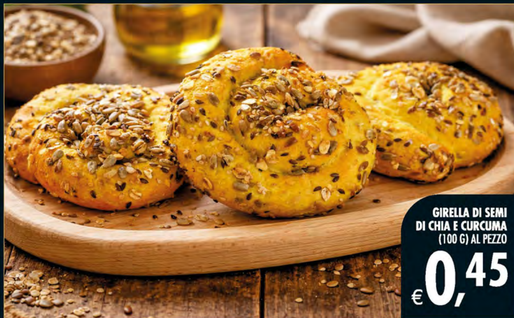
GIRELLA DI SEMI DI CHIA E CURCUMA (100 G) AL PEZZO