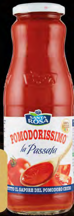
SANTA ROSA PASSATA DI POMODORO 700 G