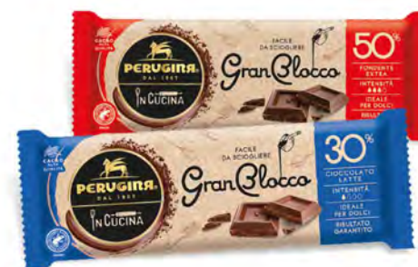
PERUGINA GRAN BLOCCO TAVOLETTE DI CIOCCOLATO VARI TIPI 150 G

€ 2,99 € 9,20/7,97 al kg VALIDO SOLO CON FIDELITY