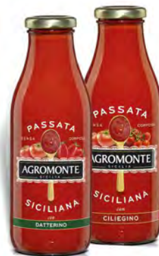
AGROMONTE PASSATA DI POMODORO CILIEGINO/DATTERINO 520 G

€ 1,19 € 2,38 al kg VALIDO SOLO CON FIDELITY