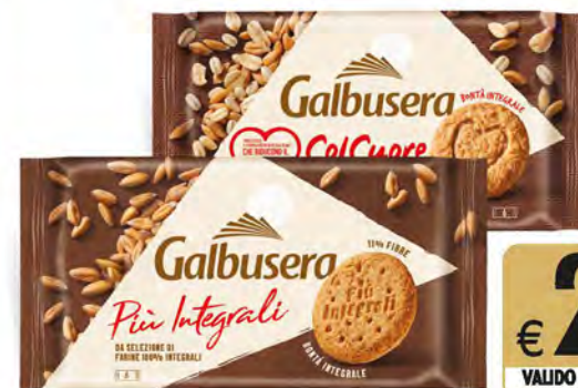
GALBUSERA BISCOTTI PIÙ INTEGRALI/ COLCUORE/ PROTEIN G 300/330 G

€ 2,59 € 8,63/7,85 al kg VALIDO SOLO CON FIDELITY