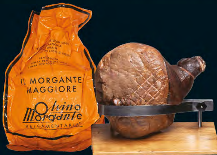
MORGANTE PROSCIUTTO DI PRAGA IN OSSO AL KG