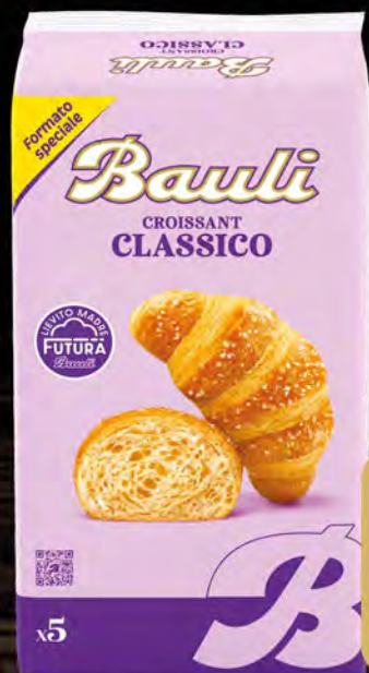
BAULI CROISSANT CLASSICI 5 PZ 200 G