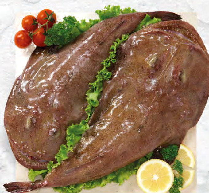
RANA PESCATRICE AL KG