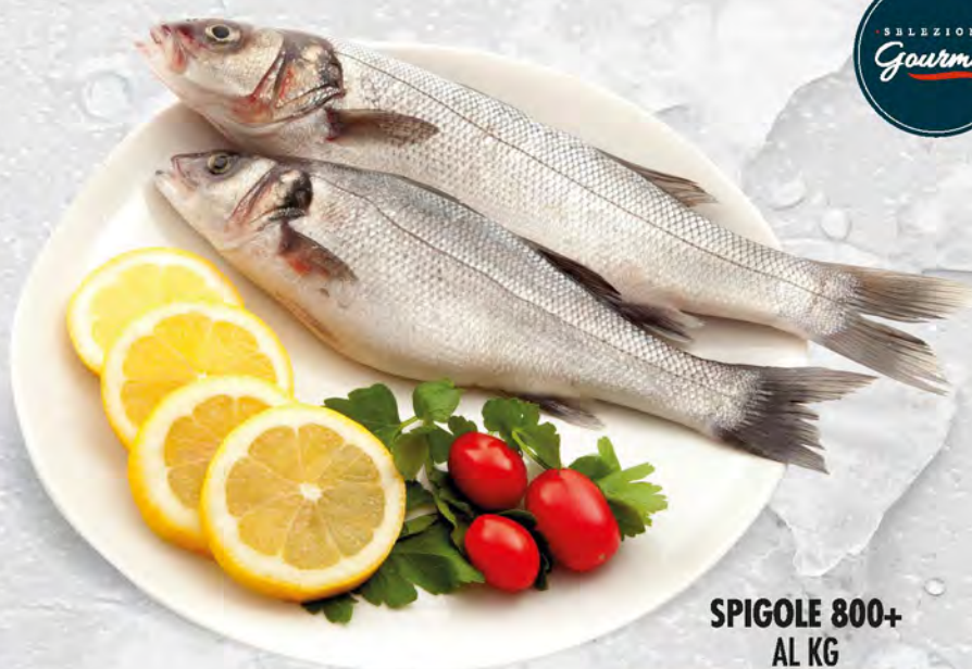
SPIGOLE 800+ AL KG