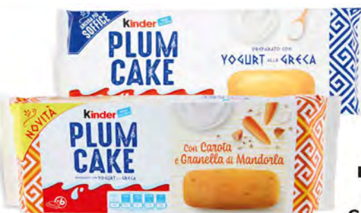
KINDER PLUMCAKE CAROTA/ YOGURT X6 192 G