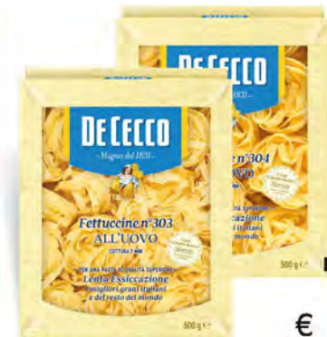
DE CECCO PASTA ALL'UOVO FETTUCCINE/ TAGLIATELLE 500 G

€ 1,29 € 2,48 al kg VALIDO SOLO CON FIDELITY