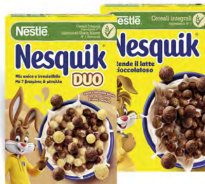
NESTLÉ NESQUIK CEREALI DUO/CIOCCOLATO/ WAVES 325/375 G

€ 2,99 € 9,20/7,97 al kg VALIDO SOLO CON FIDELITY