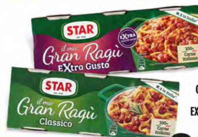
STAR GRAN RAGÙ CLASSICO/ EXTRA GUSTO 3 X 100 G

€ 1,49 € 3,73 al kg VALIDO SOLO CON FIDELITY