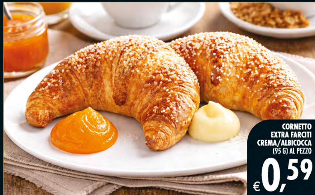
CORNETTO EXTRA FARCITI CREMA/ALBICOCCA (95 G) AL PEZZO