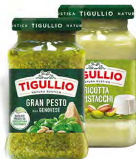
TIGULLIO STAR PESTO VARI GUSTI 190/185 G