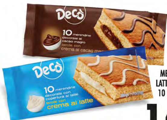
DECÒ MERENDINE LATTE/CACAO 10 PZ 280 G