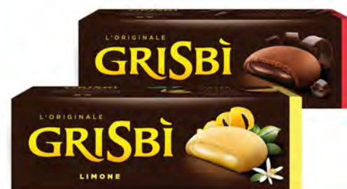
GRISBI BISCOTTI RIPIENI VARI GUSTI 135 G