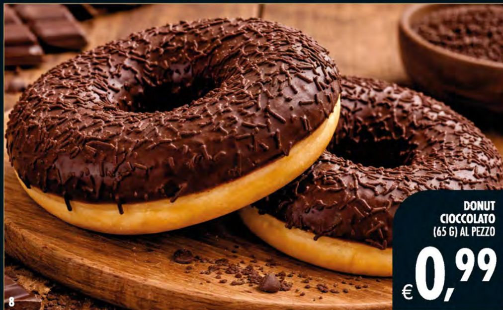
DONUT CIOCCOLATO (65 G) AL PEZZO