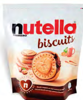
FERRERO NUTELLA BISCUITS 304 G