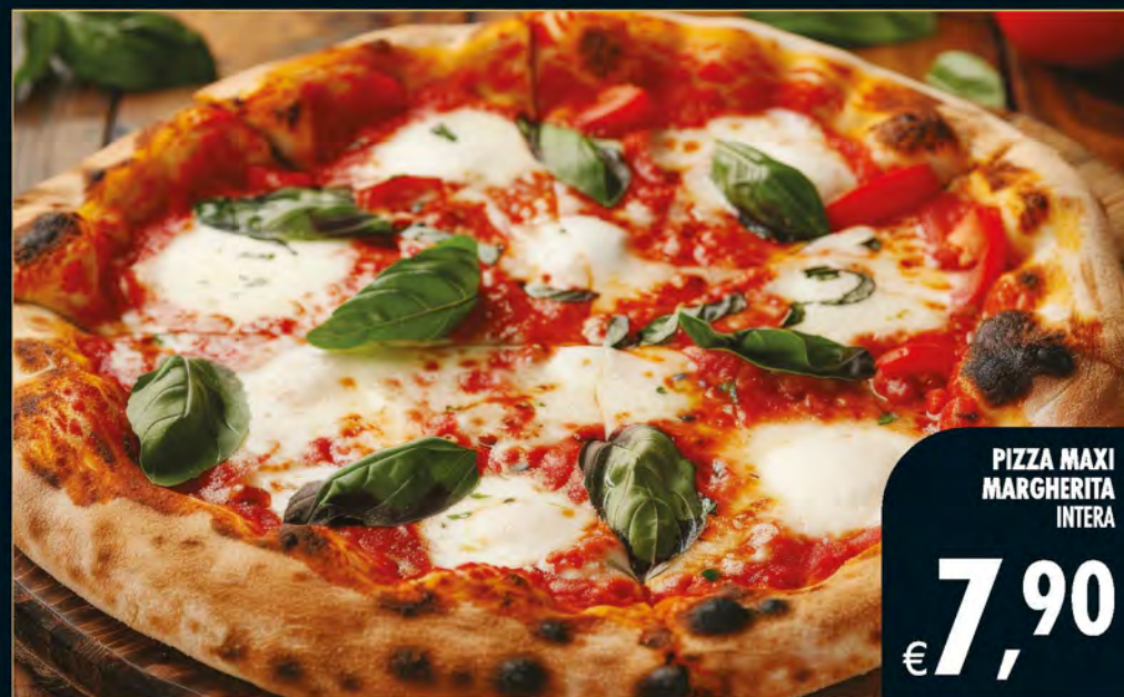
PIZZA MAXI MARGHERITA INTERA