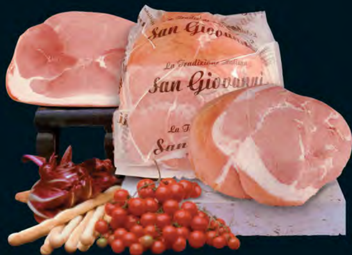
SAN GIOVANNI PROSCIUTTO COTTO AL KG