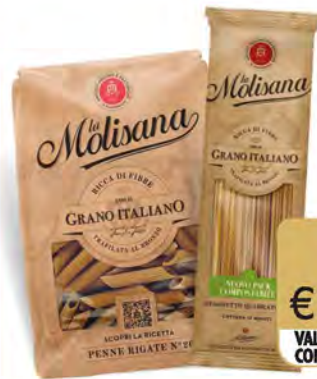
LA MOLISANA PASTA INTEGRALE VARI FORMATI 500 G

DECÒ SALSA PRONTA DI POMODORO DATTERINO/ CILIEGINO 33 CL € 1,09 € 3,30 al lt