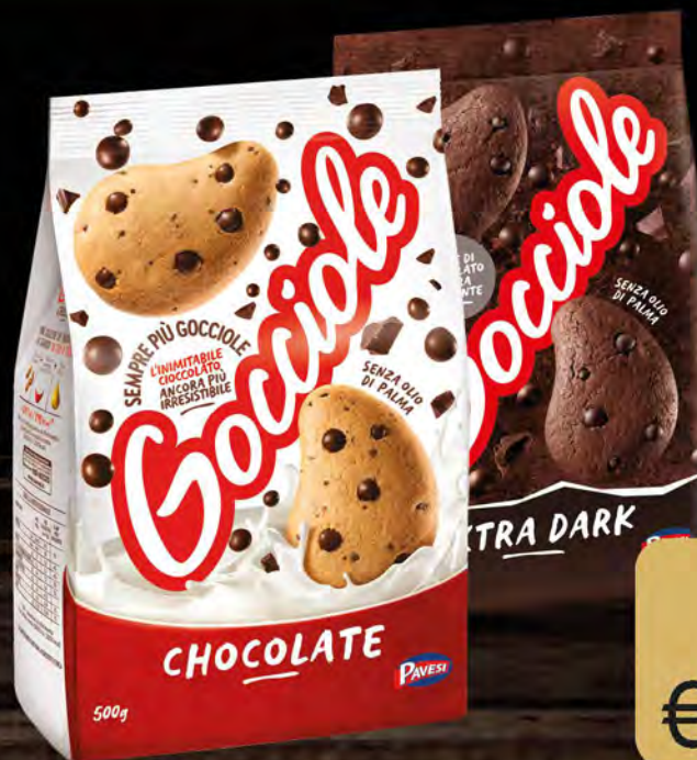
PAVESI GOCCIOLE VARI TIPI DA 320 A 500 G