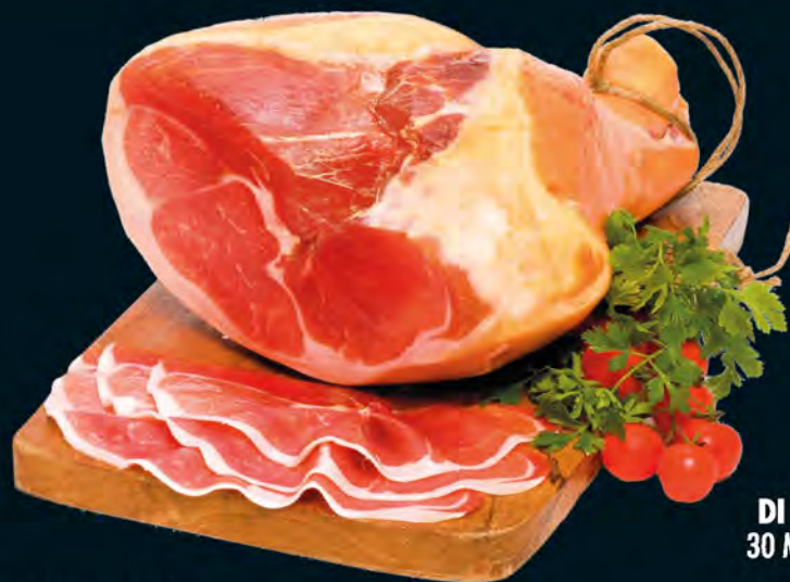
PROSCIUTTO DI PARMA D.O.P. 30 MESI SENZA OSSO AL KG