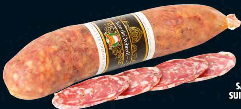
SALAME DI SUINO NERO NEBRODI AL KG