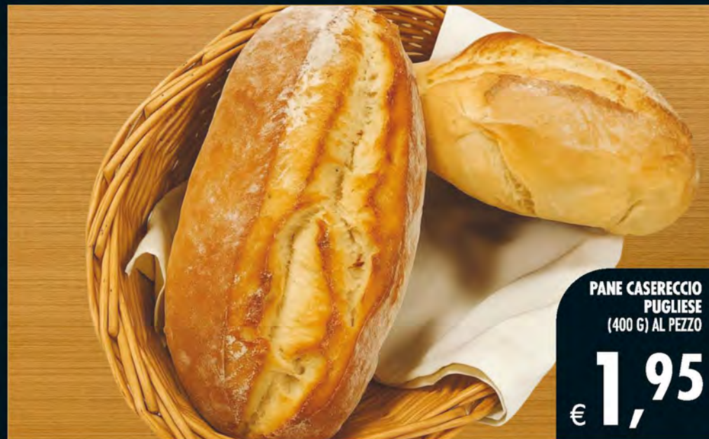
PANE CASERECCIO PUGLIESE (400 G) AL PEZZO