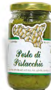
VALLE DELL'ETNA PESTO DI PISTACCHIO 190 G