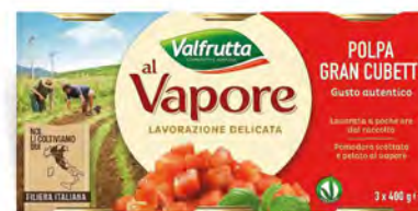
VALFRUTTA POLPA GRAN CUBETTI 3 X 400 G