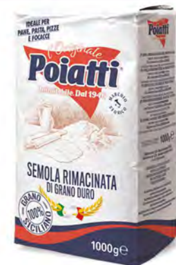
POIATTI SEMOLA RIMACINATA DI GRANO DURO 1 KG