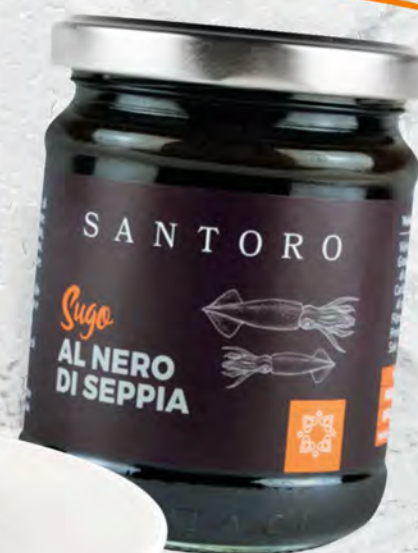
SANTORO SUGO AL NERO DI SEPPIA 180 G