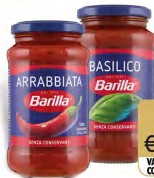
BARILLA SUGHI POMODORO CLASSICO/ ARRABBIATA/BASILICO 400 G

€ 1,49 € 3,73 al kg VALIDO SOLO CON FIDELITY