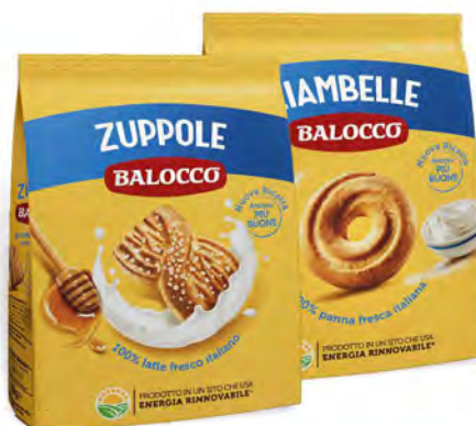
BALOCCHO BISCOTTI TIPI CLASSICI VARI TIPI 700 G