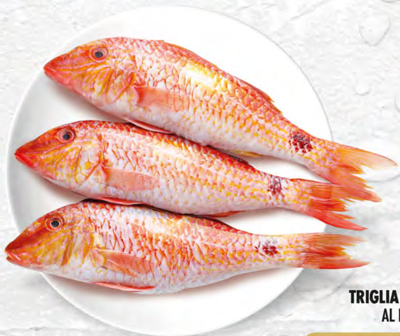
TRIGLIA ROSSA AL KG