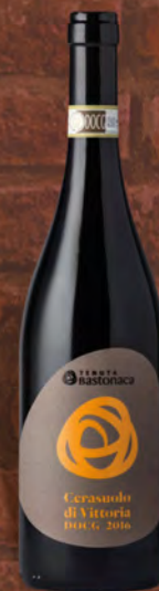
Tenuta Bastonaca Cerasuolo di Vittoria D.O.C.G. 75 cl € 11,50 ◆ € 15,33 al lt