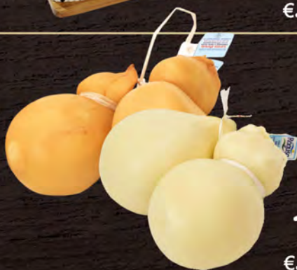
Ragusa Latte Scamorza bianca/affumicata (circa 400g) al kg