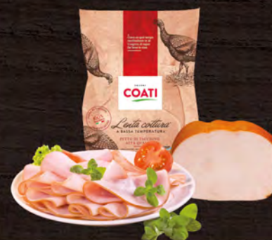
Coati Petto di Tacchino Nazionale al kg