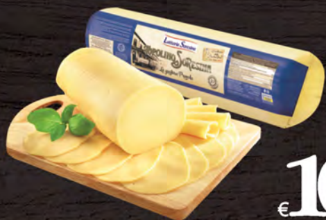
Latteria Soresina Topolino al kg