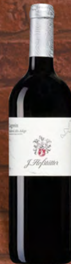
Hofstätter Lagrein rosso D.O.C. 75 cl € 11,90 ◆ € 15,87 al lt