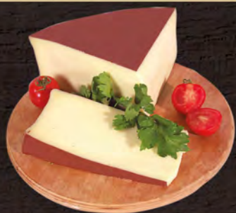
Fontal Frago al kg