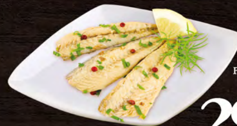
Buscema Filetti di Sgombro marinati al kg