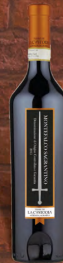
Terre De La Custodia Montefalco Sagrantino D.O.C.G. 75 cl € 9,90 ◆ € 13,20 al lt