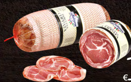
La Felinese Pancetta coppata al kg