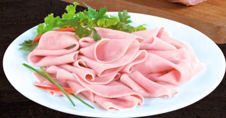
PARMACOTTO Prosciutto cotto Alta Qualità al kg