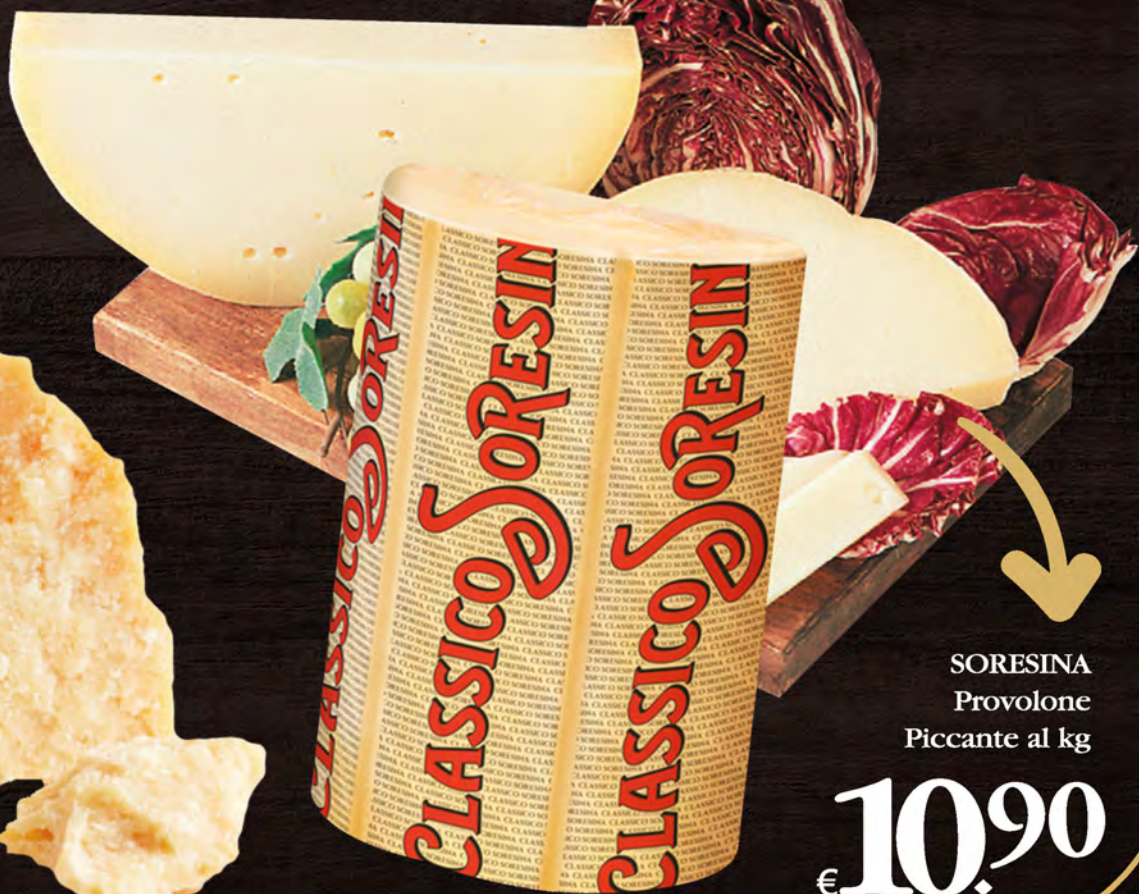
SORESINA Provolone Piccante al kg

Quello vero è uno solo. Quello vero è senza additivi e conservanti e naturalmente privo di lattosio!