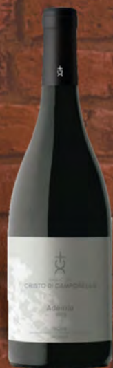
Baglio Del Cristo di Campobello Adènzia rosso D.O.C. 75 cl € 14,90 ◆ € 19,87 al lt