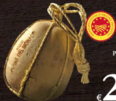
Provolone del Monaco D.O.P. al kg