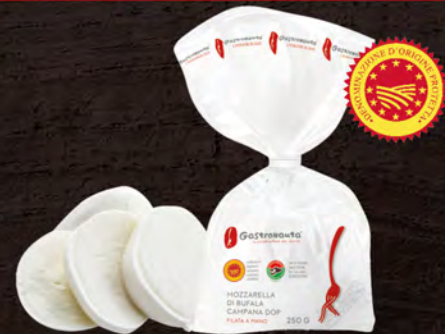
Gastronauta Mozzarella di bufala campana D.O.P. 250 g