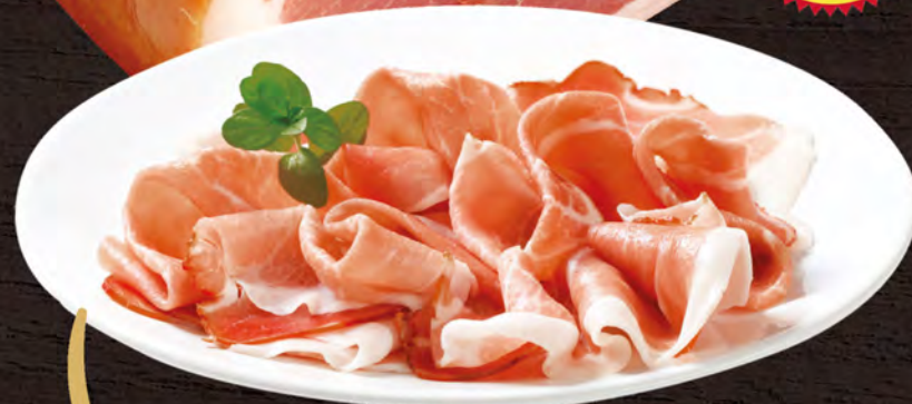
PROSCIUTTO CRUDO DI PARMA D.O.P. 20 mesi al kg