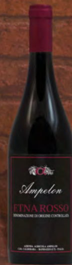
Ampelen Etna rosso D.O.C. 75 cl € 6,50 ◆ € 8,67 al lt