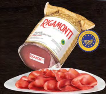
Rigamonti Bresaola Punta d'Anca I.G.P. al kg