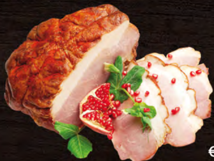
Cioli Prosciutto cotto arrosto al kg