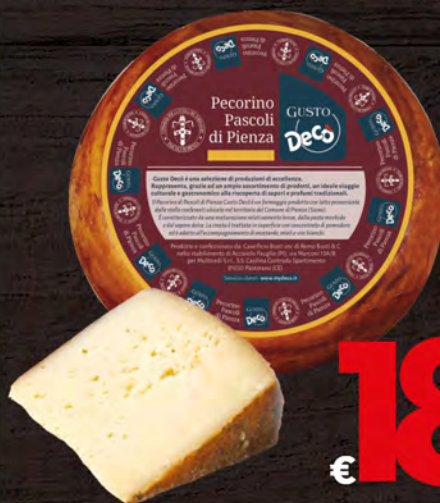
Gusto Decò Pecorino Pascoli di Pienza al kg