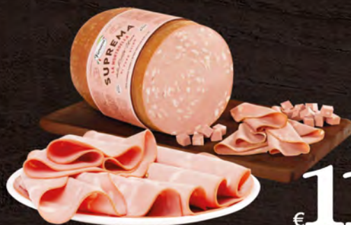
Fiorucci Mortadella Suprema al kg