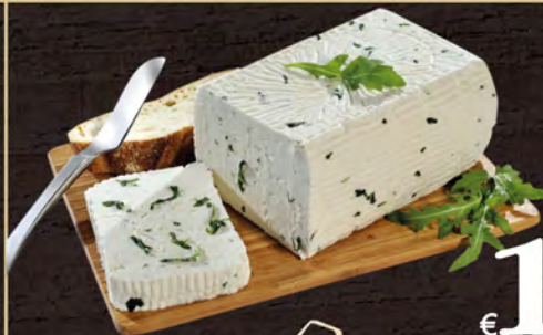
Carozzi Formaggio Delizia con rucola al kg