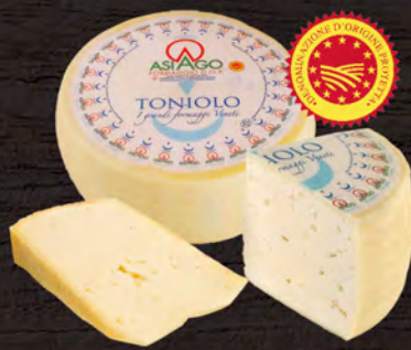
Asiago D.O.P. al kg