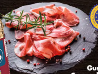
Gusto Deco Coppa di Parma I.G.P. al kg