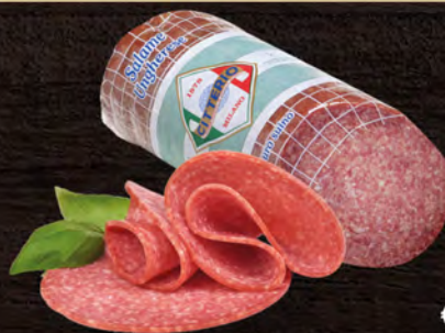
Citterio Salame ungherese al kg