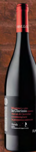
Cantine Rallo La clarissa syrah bio 75 cl € 8,90 ◆ € 11,87 al lt