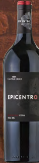
Cantina Ermes Epicentro rosso D.O.C. 75 cl € 10,90 ◆ € 11,33 al lt